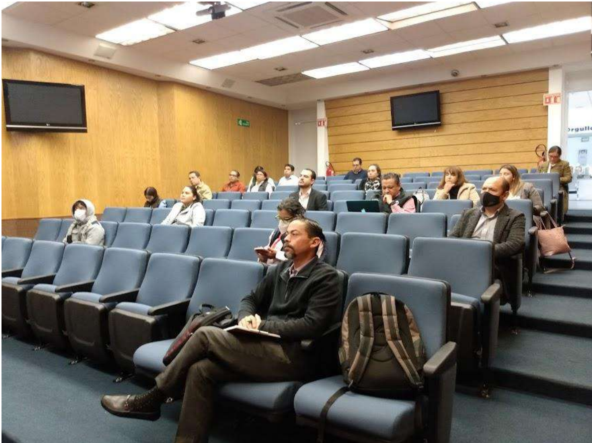
Imagen 3: Asistentes de la mesa de trabajo de “Trabajadoras del hogar”