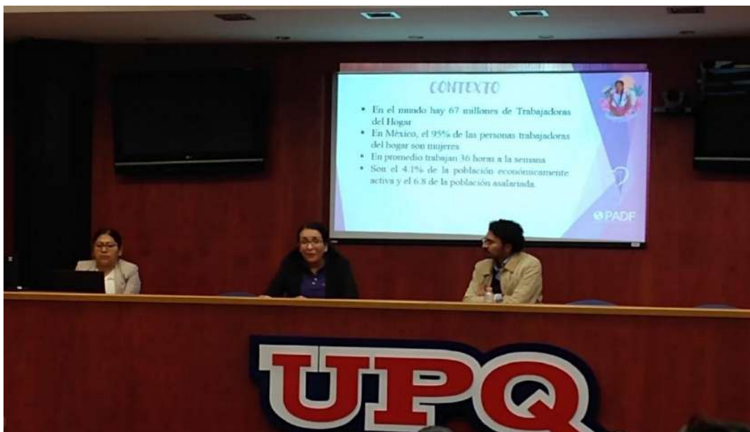
Imagen1: Exposición de Fundación Vértice “Trabajadoras del hogar”