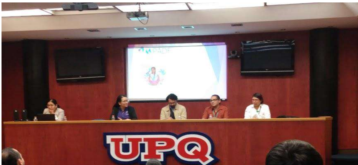
Imagen 4: Exposición de la prueba piloto de Trabajadoras del hogar por parte del IMSS