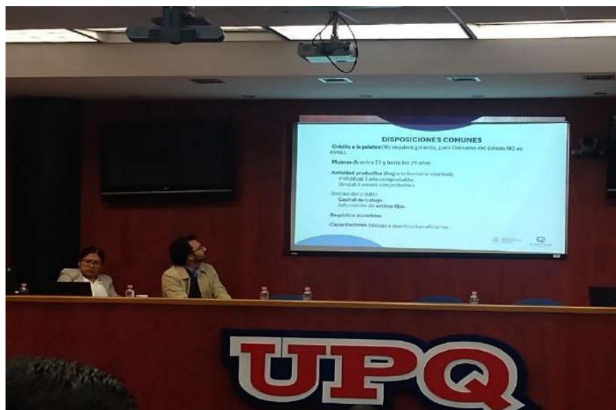
Imagen 6: Exposición del tema de Microcréditos para mujeres